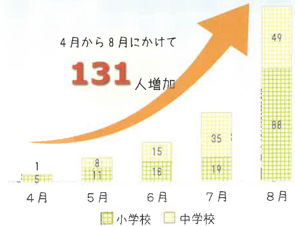
市内小中学校の月別感染者数

夏休みが明け、学校の教育活動が再開されますが、2学期の学校での感染者の増加が強く懸念されます。子どもたちの「安全確保・学びの保障」のために、学校での感染拡大防止に向け保護者の皆さまにも次の点について改めてご協力いただきますようお願いいたします。